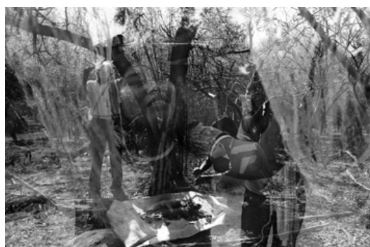
Serie Nopeyak wo, El dueño de las sombras. Sin título, 2008. Santa Victoria Este, Salta. Fotografía analógica. 40 x 60 cm.

El primer grupo de registros está compuesto por retratos de mujeres antes y después de sus rutinas diarias. Nos transporta a un instante congelado en donde la luz, los encuadres y los momentos del día se unen en perfecta armonía. Las tomas cuentan la esencia del entramado entre naturaleza y comunidad.