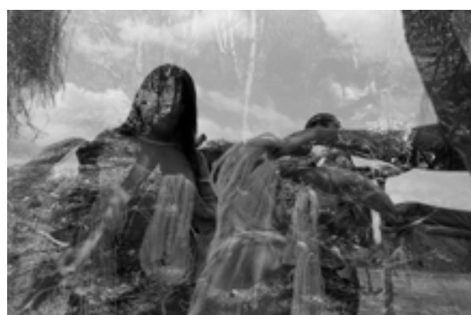
Serie Nopeyak wo, El dueño de las sombras. Sin título, 2008. Santa Victoria Este, Salta. Fotografía analógica. 40 x 60 cm.