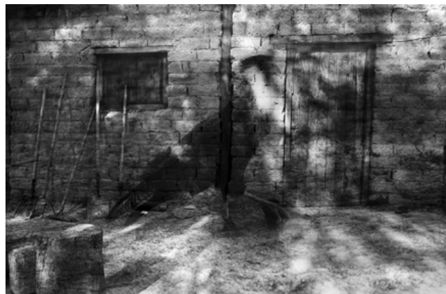
Serie Nopeyak wo, El dueño de las sombras. Sin título, 2008. Santa Victoria Este, Salta. Fotografía analógica. 60 x 90 cm.

Esta serie fue realizada en Santa Victoria Este, en el seno de la comunidad Wichi del Chaco Salteño durante el año 2008. En este trabajo se produce un doble acto performático en la acción del fotógrafo. Mediante la yuxtaposición de imágenes de manera azarosa Romano logra capturar dos espacios temporales que difieren en días y horarios, haciéndonos testigos íntimos de lo inquieto del tiempo. Cabría la posibilidad de preguntarnos si este fenómeno es el verdadero producto de la influencia del entorno místico, o es solo una posibilidad técnica que el artista tuvo la suerte de experimentar con un resultado extraordinario, que no deja de tener misterio, y que no deja de sorprender.