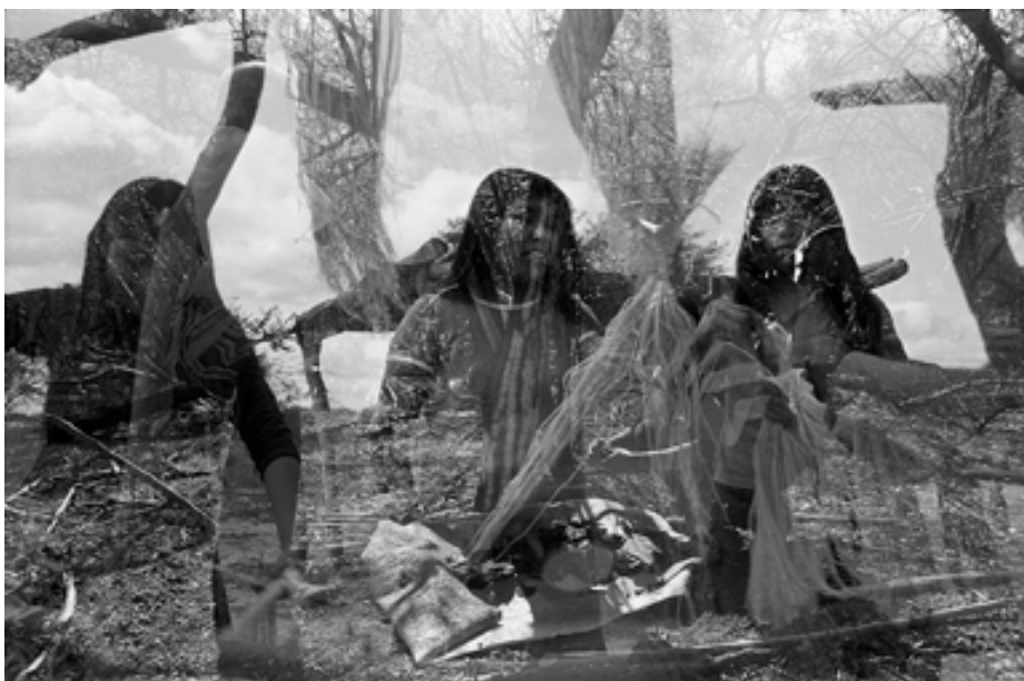
Serie Nopeyak wo, El dueño de las sombras. Sin título, 2008. Santa Victoria Este, Salta. Fotografía analógica. 40 x 60 cm.

Esta muestra explora lo que ya pasó, lo ancestral y de cómo ese espacio ya transitado por el tiempo puede convertirse en una poderosa fuerza creativa. Se invita al público a entrar en el mundo intrigante de la cosmovisión Wichi, amalgamando el lirismo de nuestra propia existencia con fuerzas sobrenaturales.