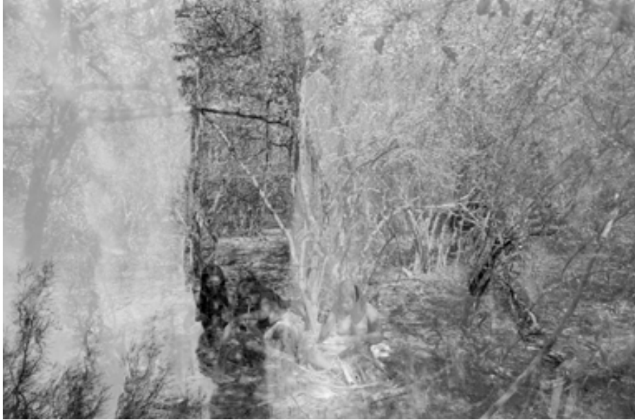
Serie Nopeyak wo, El dueño de las sombras. Sin título, 2008. Santa Victoria Este, Salta. Fotografía analógica. 40 x 60 cm.

La exhibición incluye 17 fotografías analógicas que dan cuenta de la vida cotidiana de la comunidad, así como también retratos de sus miembros y de Tiluk, el chamán que se convierte en el hilo conductor del relato, indagando en el poder y el artificio, siendo el puente entre nuestra existencia y lo ancestral. Romano relata que las fotografías superpuestas por accidente son el resultado de cosas que suceden en "segundos planos", los cuales son técnicamente imposibles de captar por las cámaras. El fotógrafo aclara que ante esta dificultad, el mismo chamán ofreció su ayuda para realizar las tomas.