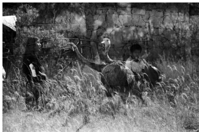
Serie Nopeyak wo, El dueño de las sombras. Sin título, 2008. Santa Victoria Este, Salta. Fotografía analógica. 40 x 60 cm.