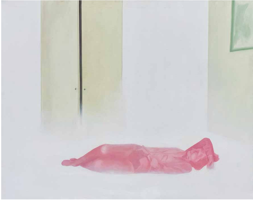
"Paisaje" Serie "¿A que le temerá la ausencia?". Óleo sobre tela. 80x100 cm, 2019.