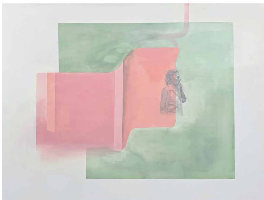
S/T. Serie "¿A que le temerá la ausencia?". Óleo sobre tela 60 x 70 cm 2019.