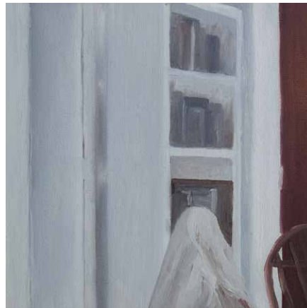
S/T, 2020. Serie "La nostalgia del espacio". Óleo sobre tela 21 x 21 cm enmarcado.