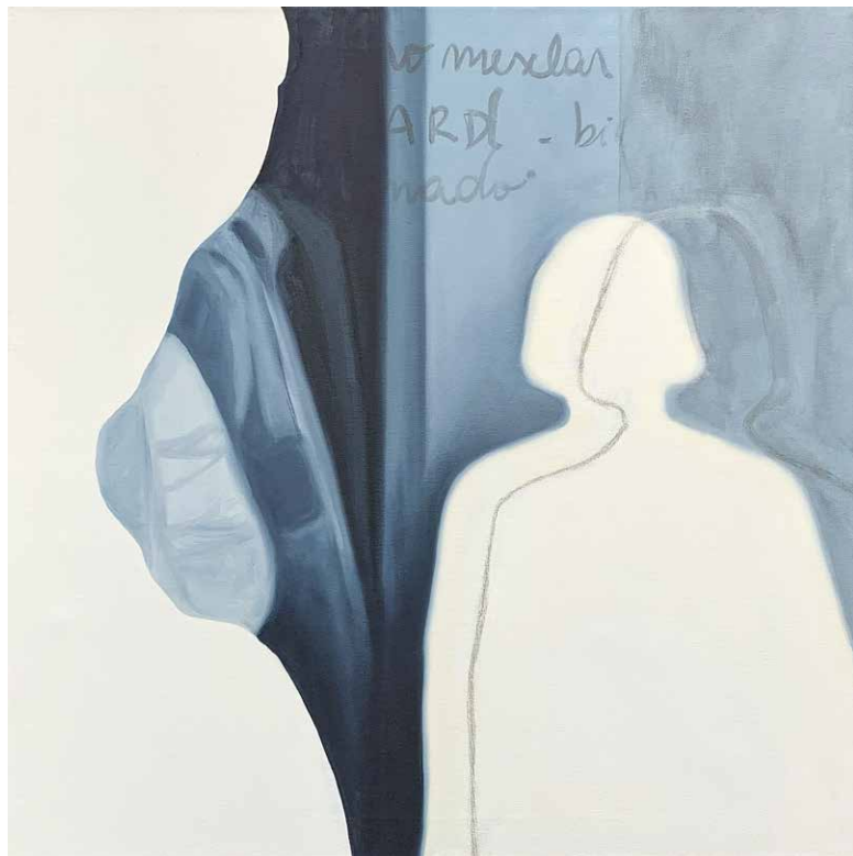
"Preludio" Serie "¿A que le temerá la ausencia?". Óleo sobre tela 70 x 70 cm 2019.