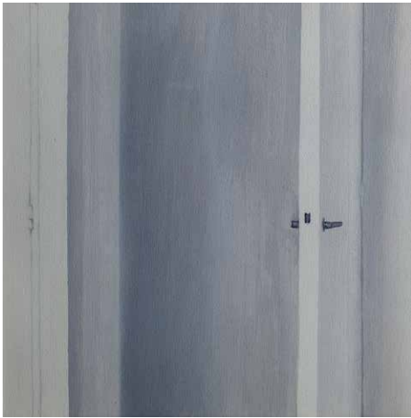
S/T, 2020. Serie "La nostalgia del espacio". Óleo sobre tela 20 x 20 cm enmarcado.