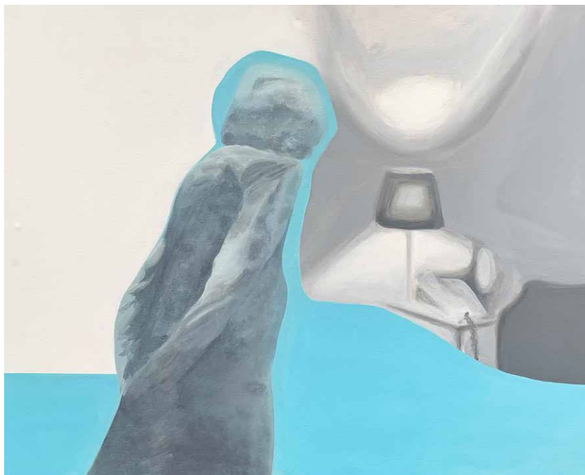
"Un día con cualquiera de sus noches". Serie "¿A que le temerá la ausencia?" Acrílico sobre tela. 80x100 cm ,2019