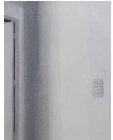
S/T, 2020. Serie "La nostalgia del espacio". Óleo sobre tela 20 x 23 cm enmarcado.