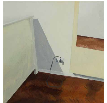
S/T, 2020. Serie "La nostalgia del espacio". Óleo sobre tela 21 x 21 cm enmarcado.