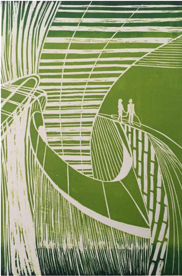
Ana Paula Fiorentino. Serie Sin título N°1. 2019. Xilografía. 50 x 35 cm.