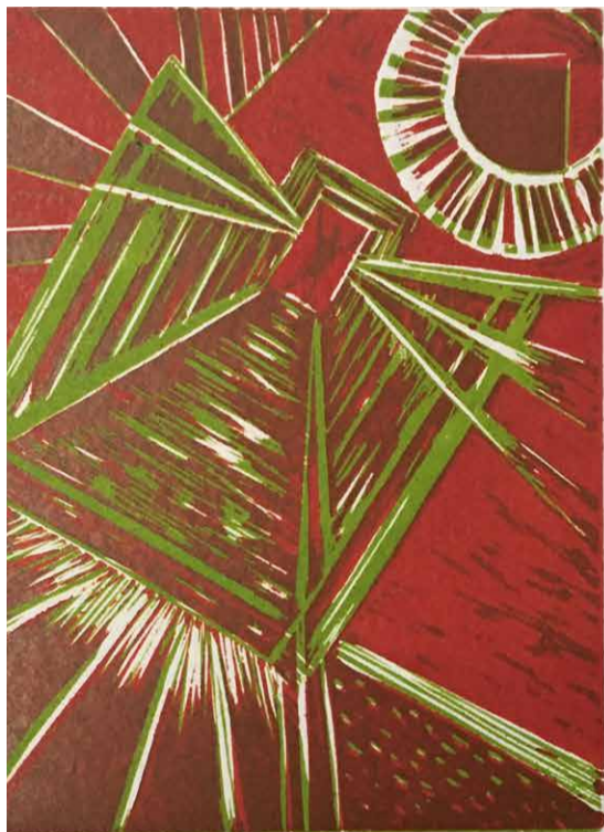
Ana Paula Fiorentino. Serie "El Puente" N°2, 2019. Xilografía, bicromía. 50 x 35 cm.