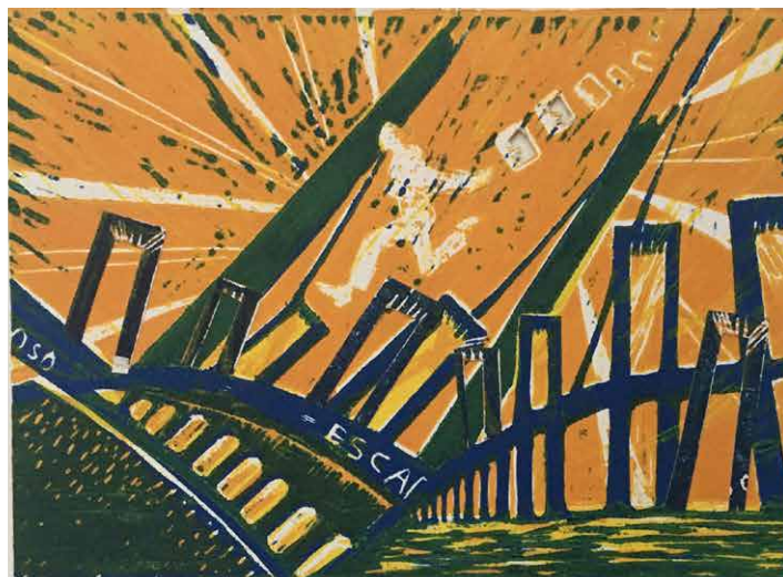
Ana Paula Fiorentino. Serie Escape. N°2. 2019. Xilografía y collage, tricromía. 35 x 50 cm.