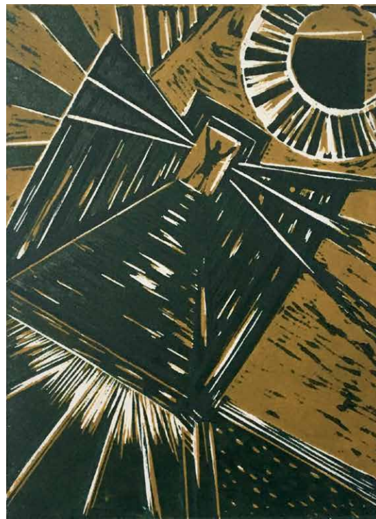
Ana Paula Fiorentino. Serie "El Puente" N°1, 2019. Xilografía, bicromía. 50 x 35 cm.