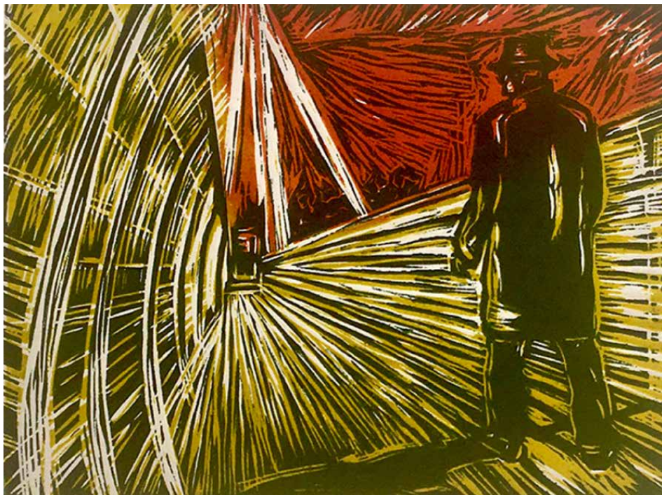
Ana Paula Fiorentino. Serie "La Espera" N°2, 2019. Xilografía, camafeo. 35 x 50 cm.