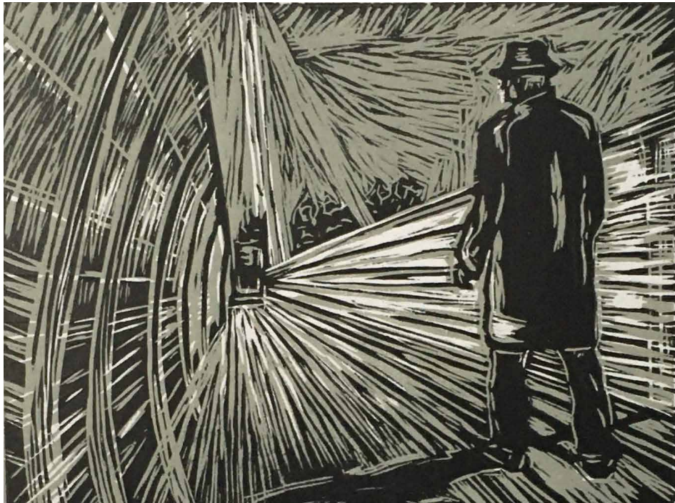
Ana Paula Fiorentino. Serie "La Espera" N°1, 2019. Xilografía, camafeo. 35 x 50 cm.