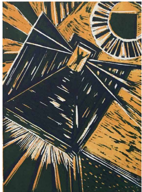
Ana Paula Fiorentino. Serie "El Puente" N°3, 2019. Xilografía, bicromía. 50 x 35 cm.