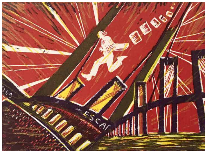
Ana Paula Fiorentino. Serie Escape. N°1. 2019. Xilografía. 35 x 50 cm.