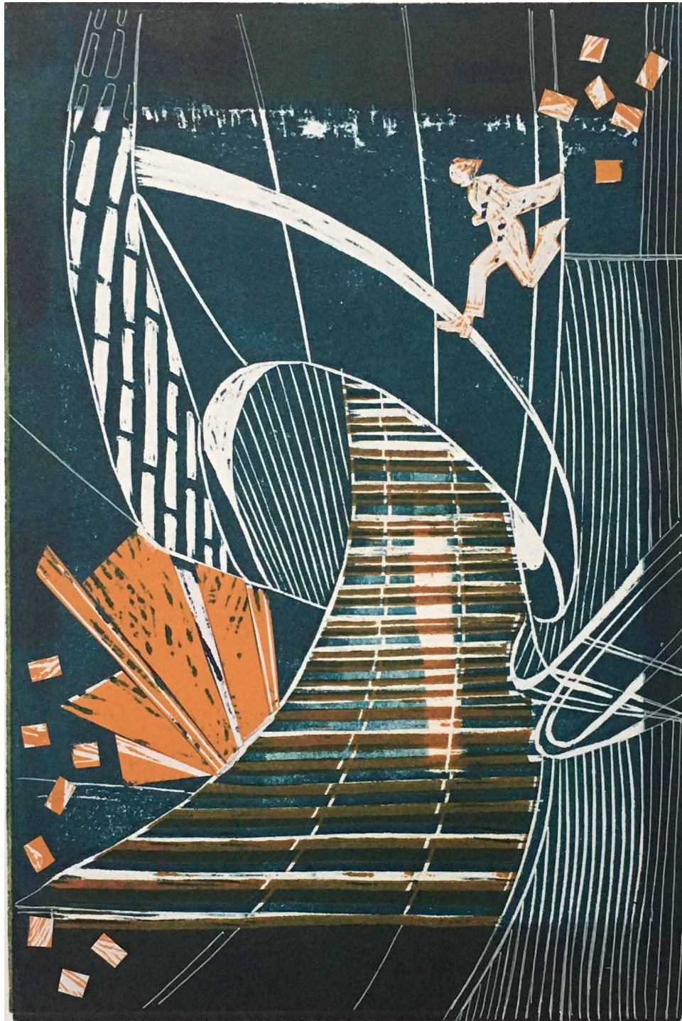
Ana Paula Fiorentino. Escape IV , 2019. Xilografía y collage. 50 x 35 cm.